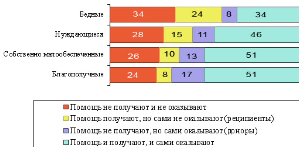
Рис. 3. Участие во взаимопомощи представителей различных социальных слоев (2008 г., в %)

Включенность в социальные сети, по каналам которых циркулирует большой объем трансфертов как в натуральной, так и в денежной форме, является нормой жизни всех слоев российского общества.