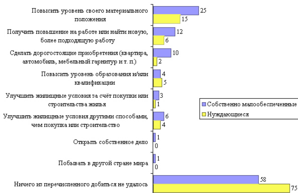
Рис. 1. Чего удалось добиться за период 2006-2008 гг. малообеспеченным и нуждающимся россиянам, %

ных российских граждан не сумели добиться за последние годы каких-либо качественно значимых изменений в своей жизни (см. рис. 1).